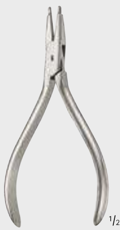
Plate cutting forceps Plattenschneidezange 120 mm, 4 3/4"